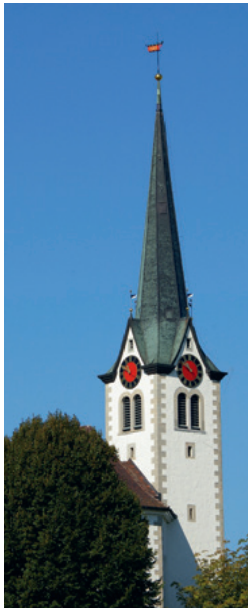
Am 22. und 23. Juni werden in Stein neue Kirchturmgeschichten geschrieben.

eindruckend. Gerne ermunterte ich die Kinder, nach dem Stundenschlag unter die grösste Glocke zu stehen, um zu spüren, dass der Klang nicht nur hörbar, sondern als Schwingung auch körperlich noch lange fühlbar ist. Manche genossen die Aussicht durch die schmalen Fensternischen, den Blick in die Tiefe. Andere blieben in sicherer Distanz oder suchten eine Hand zum Festhalten. Technisch interessierte Kinder blieben staunend vor dem grossen Schrank mit den vielen Zahnrädern, Stangen, Ketten und Gewichtssteinen stehen, die früher das Uhrwerk und die Glocken steuerten.