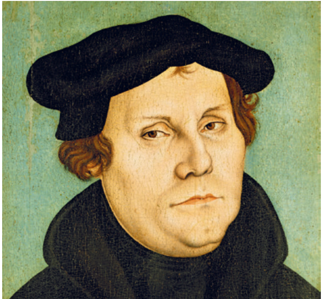
Martin Luther (1483 – 1546) bezeichnete seine Erkenntnis aus dem 1. Kapitel des Römerbriefs als unerwartete Erleuchtung.

Unser Glaube reicht. Er ist gut genug, mit allem, was ihn ausmacht – die tiefen spirituellen Momente, die Zweifel, die offenen Fragen, die Gebete, die Freude an biblischen Texten, die Unterstützung von anderen Menschen. Unser Glaube, der manchmal selbstverständlich und manchmal herausfordernd ist, reicht. Weil Gott uns liebt, so wie wir sind. Das ist die bahnbrechende Erkenntnis der Reformation.