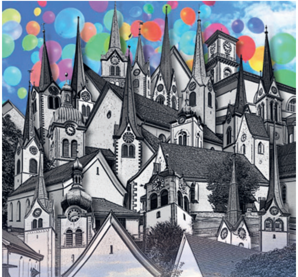
Wie unser Glaube: 19-mal verschieden. Alle reformierten Türme im Appenzellerland auf einen Blick (ohne Appenzell). Collage: Elisabeth Bruderer

Sicher kennen Sie gotische Kirchtürme, die aussehen, wie wenn sie nicht ganz fertig gebaut wären, weil ihnen die Spitze oder der Helm fehlt wie beispielsweise bei der Kathedrale von Fribourg. Bei diesen Türmen hat nicht die Baustatik, sondern die Theologie die Architektur