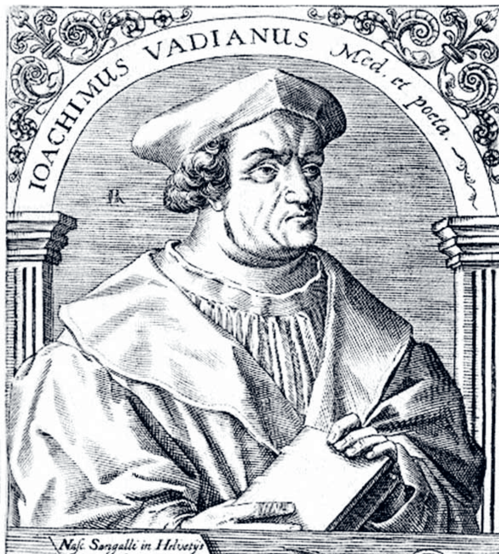
Der St. Galler Reformator Joachim von der Watt, besser bekannt als Vadian.

Das Mandat konnte aber die Lage nicht beruhigen. Die Regierung wollte die Situation klären und lud im Juli desselben Jahres zu einem Glaubensgespräch, einer Disputation, nach Appenzell ein. 300 Personen folgten dieser Einladung, doch dauerte die Veranstaltung keine halbe Stunde, musste sie doch wegen tumultartigen Zuständen abgebrochen werden. Die Gegensätze zwischen Altgläubigen und reformatorischen Kräften hatten sich zu sehr verschärft. Besonders im Hauptort Appenzell kam es zu grossen Spannungen. Auch auf dem Land gab es Aufsehen erregende Vorfälle. Beispielsweise besetzten etwa hundert Män-