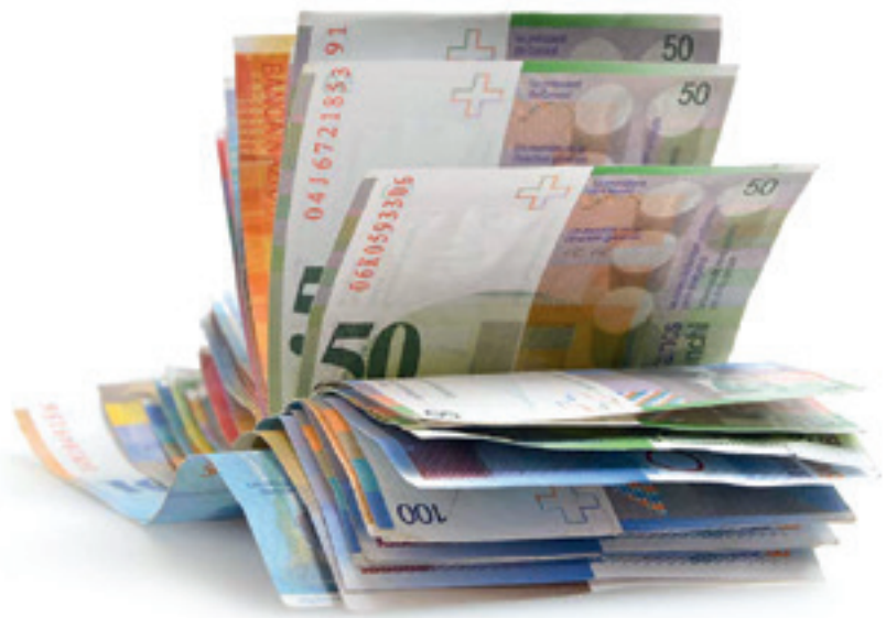
Die Schadenssumme von Personen 55+ hat in der Schweiz von 400 auf 675 Millionen Franken zugenommen.