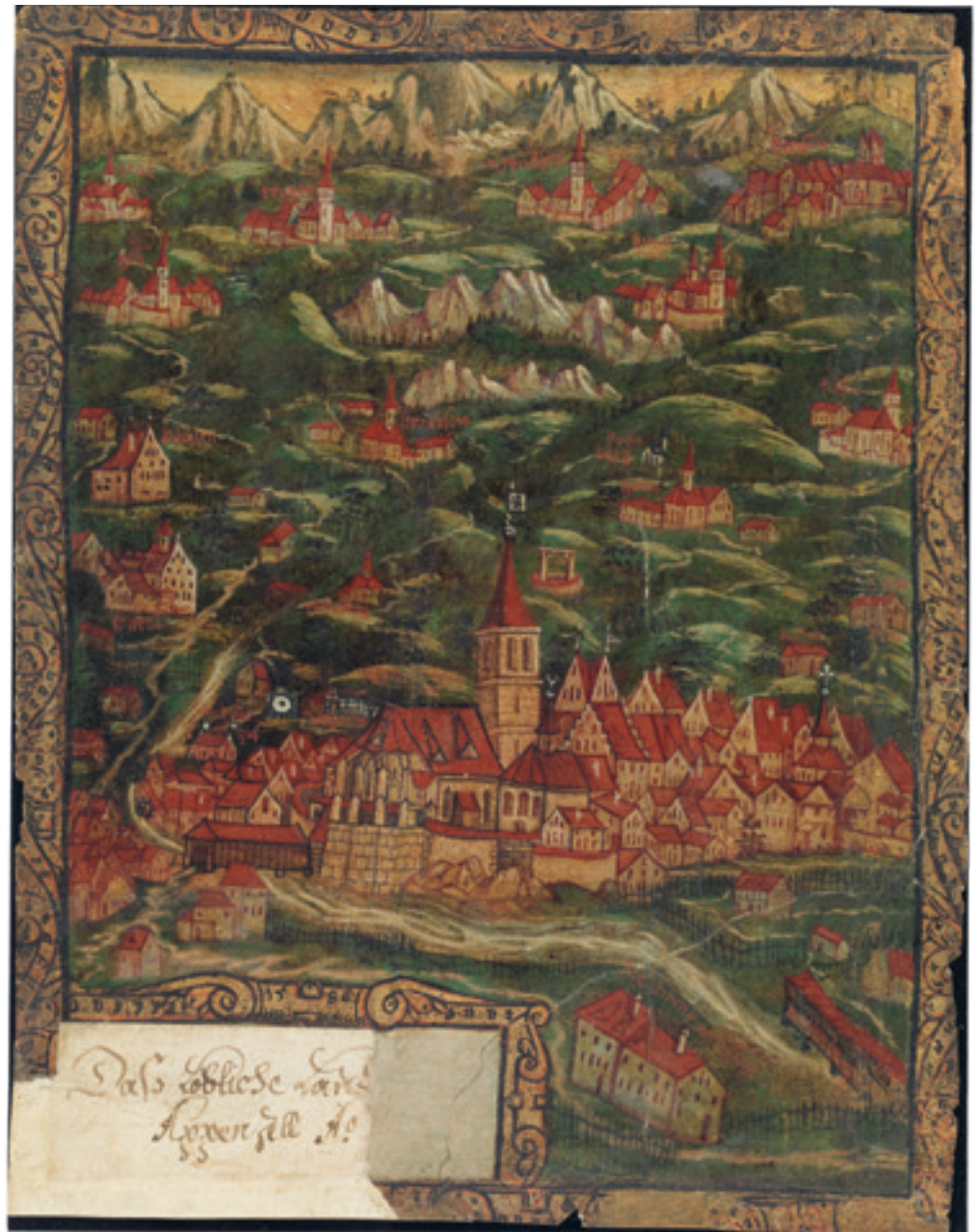
Darstellung des Landes Appenzell im so genannten «Silbernen Landbuch» von 1585. Im Zentrum das Dorf Appenzell.

Der Landteilungsbrief umfasste gerade einmal 17 Artikel, wobei nur die wichtigsten Punkte geregelt wurden, etwa die Teilung des gemeinsamen Besitzes, das künftige Verhältnis zur Eidgenossenschaft oder die Aufbewahrung von wichtigen Dokumenten. Zur Wahrung des konfessionellen Friedens verbot ein Artikel gegenseitige Schmähungen. Und die Innerrhoder durften weiterhin zur Stoss-Kapelle wallfahren. Der ganze Vertrag ist von Pragmatik, nicht von Weitblick geprägt. So wurden im gemischtkonfessionellen Gebiet um Oberegg katholische Bewohner den inneren Rhoden zugeordnet, die reformierten den äusseren. Wechselte eine Liegenschaft in die Hand der anderen Konfession, wechselte die territoriale Zugehörigkeit. Spätere Verträge versuchten solche Unklarheiten des Landteilungsvertrages zu verbessern.