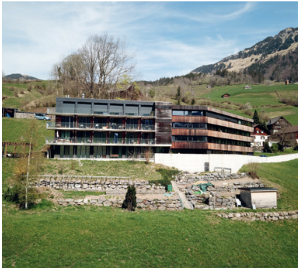
Das Wohnheim Felsengrund besteht seit 1956 und ist politisch und konfessionell unabhängig.