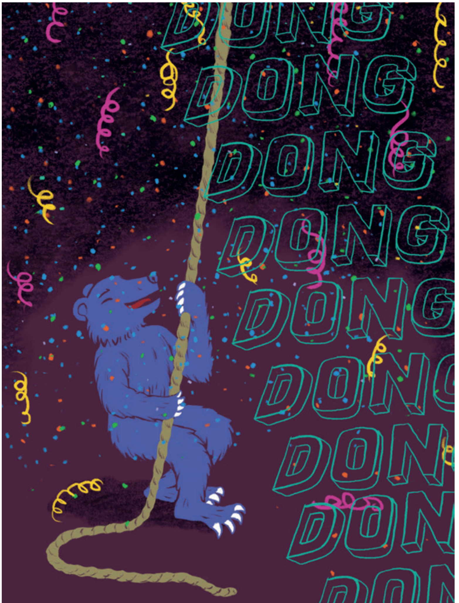
Illustration: Jonathan Németh