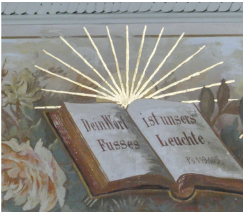
Ohne Licht tappen wir im Dunkeln; ohne (innere) Ausrichtung drehen wir uns im Kreis. Dieser Text von Psalm 119 wurde abgeändert. In der Bibel heisst es «meines Fusses». Quelle: Irina Bossart

Beginnen wir – in der Leserichtung – links aussen: Der Vers stammt aus dem ersten Johannesbrief; das Schriftband gibt allerdings nur den Anfang des Satzes wieder. In etwas altertümlichem Deutsch steht da: «Sehet, welch eine Liebe hat uns der Vater erzeiget». In einer moderneren Übersetzung und vervollständigt lautet der Vers: «Seht, wie gross die Liebe ist, die der Vater uns geschenkt hat: Wir heissen Kinder Gottes und wir sind es auch!» Im Vers wird eine grosse Zusage gemacht: Gottes Liebe ist bedingungslos und wir sind Gotteskinder. Die Erfahrung des Geliebt-Seins ist fundamental; ohne Zuwendung und Liebe kann sich menschliches Leben kaum entfalten. Aus solch existenzieller Anerkennung schöpfen wir Lebenslust und Lebensmut. Im zweiten Teil des Satzes bezeichnet der Autor die Adressat:innen des Briefes als