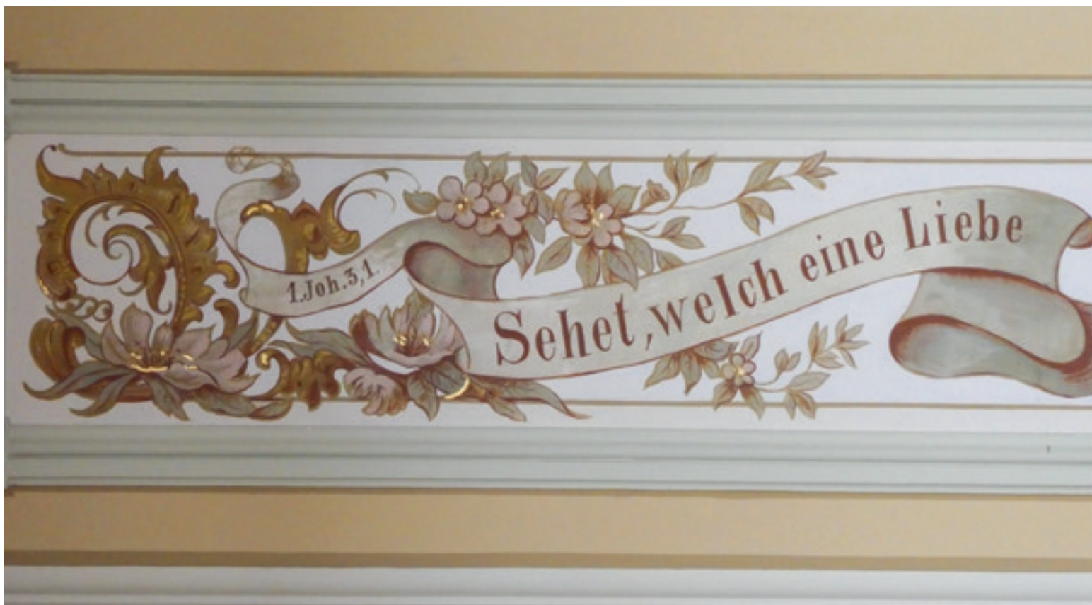
Kircheninschriften wirken als Kundgabe des Glaubens, sind Identitätsmarker, Zierde und Sinnspruch in einem.