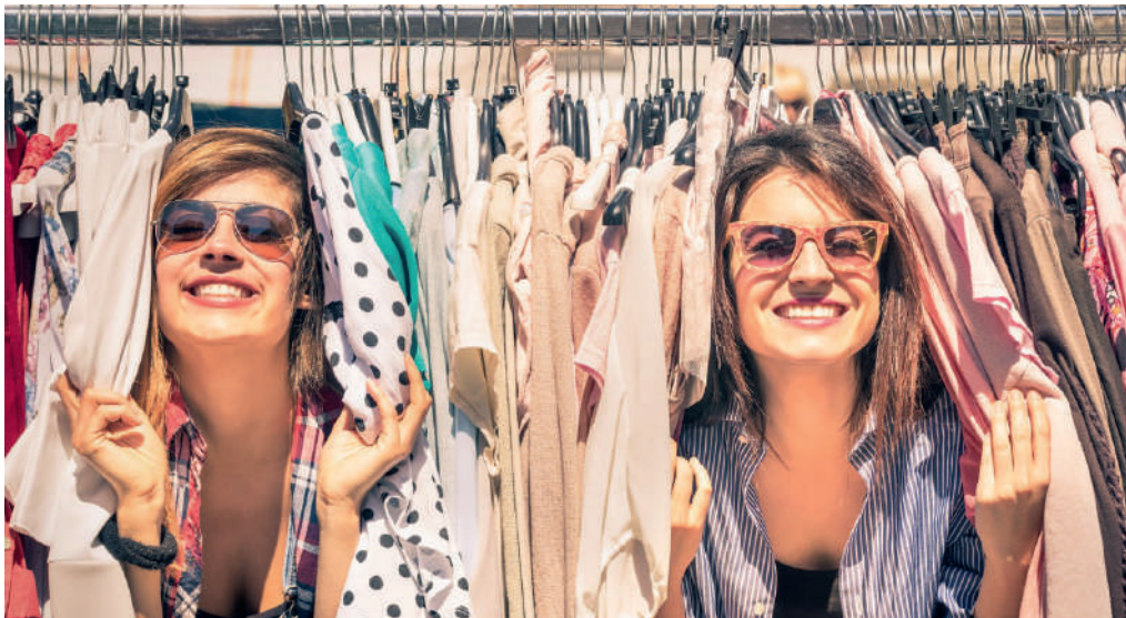
Von Frauen – für Frauen.