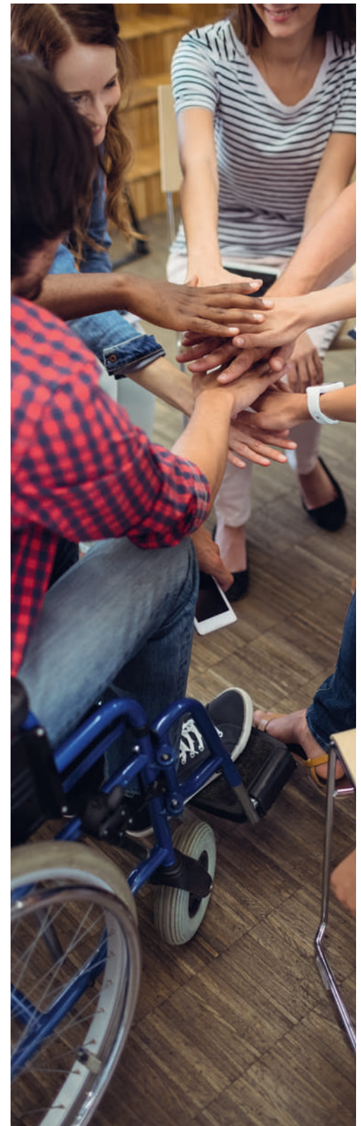
Diversität und Inklusion kann Grenzen sprengen.

rück an die Konfirmation einer jungen Frau mit Beeinträchtigung. Eine stimmige Feier für Familie und Gemeinde!