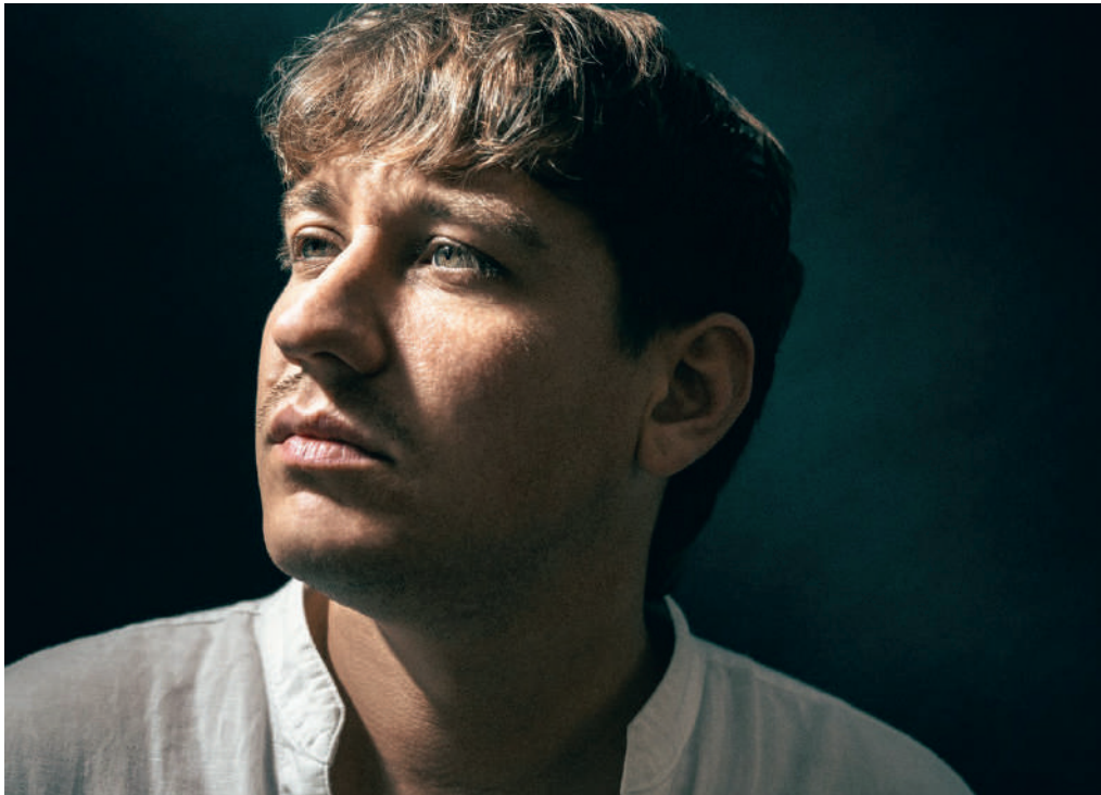
Marius Bear hat 2022 am ESC teilgenommen.