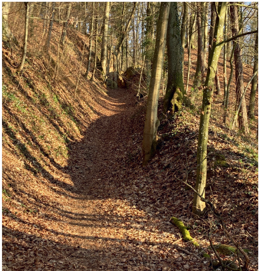
Lieber Wege anstatt Gräben wie hier in Neumarkt in der Oberpfalz.

wirtschaften. Eins sein in Christus heisst sich verbinden mit allen Teilen dieses unsichtbaren, mystischen Leibes Christi, sich Freuen mit den Fröhlichen, Weinen mit den Weinenden. Das heisst, dafür einstehen, dass sich alle zugehörig fühlen können. Das heisst, sich selbst zugehörig wissen mit allem, was gerade ist. Ich sage es mit Martin Luther King: «I have a dream». Ja, ich träume davon, dass wir als Kirchen Brücken bauen können über Gräben, dass wir verbinden können anstatt zu spalten, dass wir Konflikte und Gegensätze offen und fair austragen. Dass wir in der Lage sind, Widersprüchlichkeiten und Diversität auszuhalten im Wissen des Einsseins jenseits aller Gegensätze. Wovon träumen Sie?