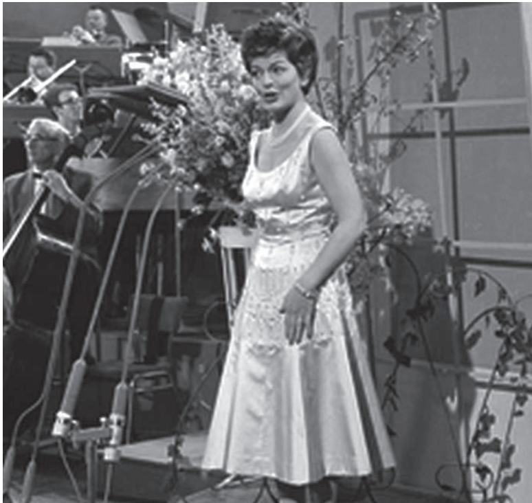
Von Lys Assia zu Nemo: Nach 69 Jahren ist die ESC-Austragung wieder in der Schweiz.