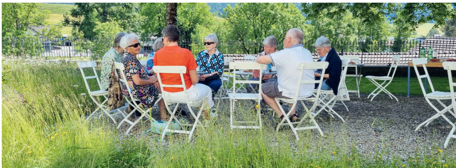
Zwangloses «Käfele» im Garten.

Helfern. Auch in diesem Jahr findet das «Sonnen-Café» vier Mal statt. Von Juni bis September. Abwechslungsweise im Garten der evangelischen und der katholischen Kirche. Sollte es mal schlechtes Wetter sein, wird der Anlass in die beiden Kirchgemeindehäuser verlegt. Bis heute hat sich der Anlass etabliert und wird von den Besucherinnen und Besuchern geschätzt. Es treffen sich immer etwa 20 Interessierte, die meisten im Pensionsalter. Das Angebot ist jedoch für