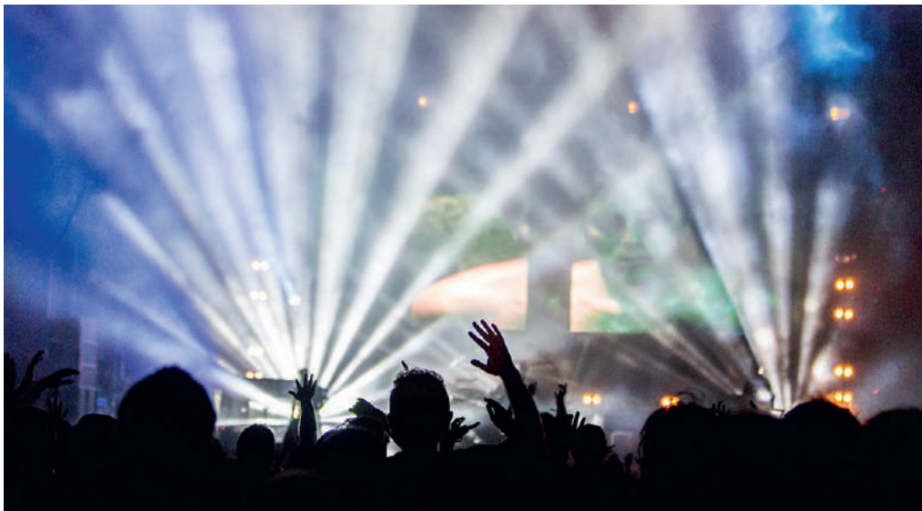
Vom biederem Liedvortrag zum Multimedia-Spektakel.

Für viele Musiker:innen ist der ESC im Lauf der Zeit eine wichtige Plattform für ihre Bekanntheit geworden. Je nach Generation kennt man die Interpret:in noch oder ist sogar durch die Sendung zum Fan geworden.